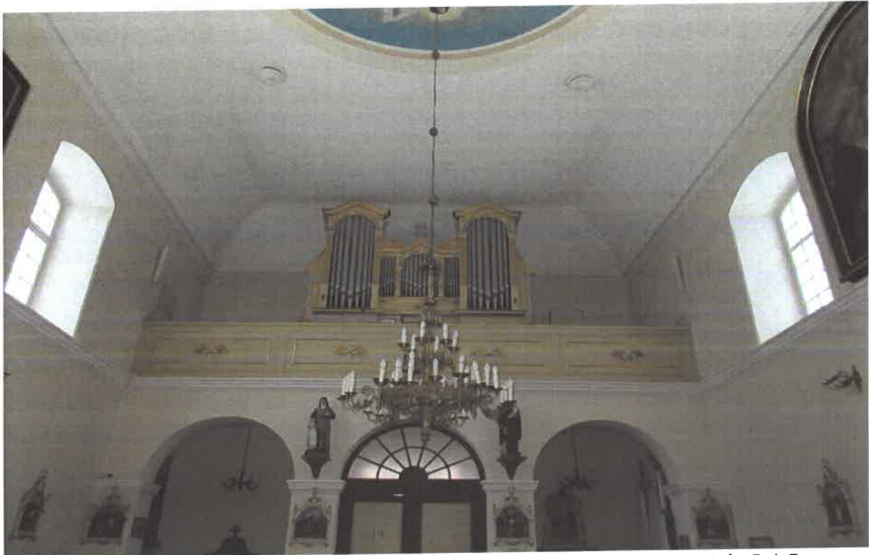
Fot. nr 2 – Milanów, Kościół pod wezwaniem Niepokalanego Poczęcia NMP, chór. Fot. Tomasz Iwanicki, Luty 2023.