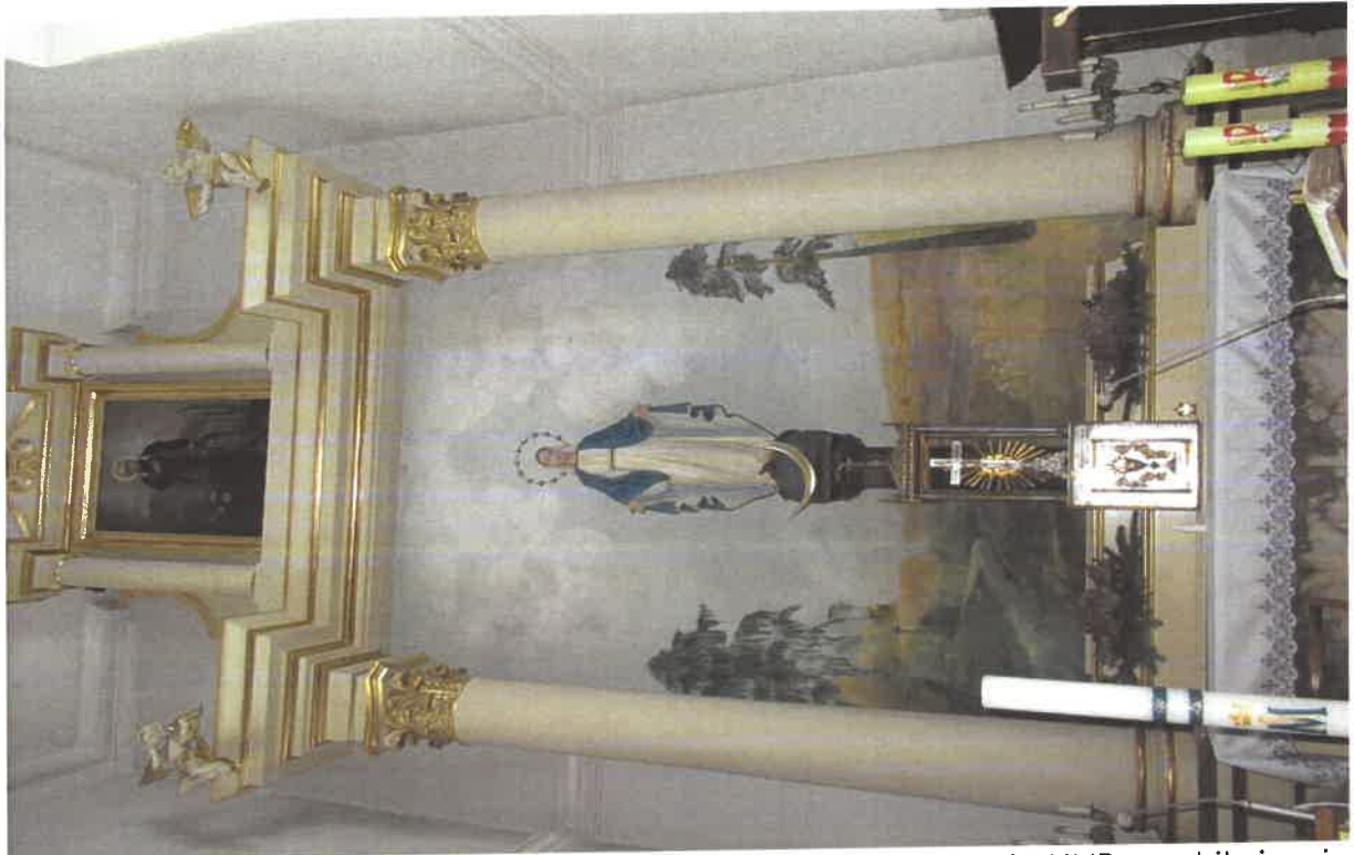
Fot. nr 8 - Milanów, Kościół pod wezwaniem Niepokalanego Poczęcia NMP, prezbiterium i ołtarz główny. Fot. Tomasz Iwanicki, Luty 2023.