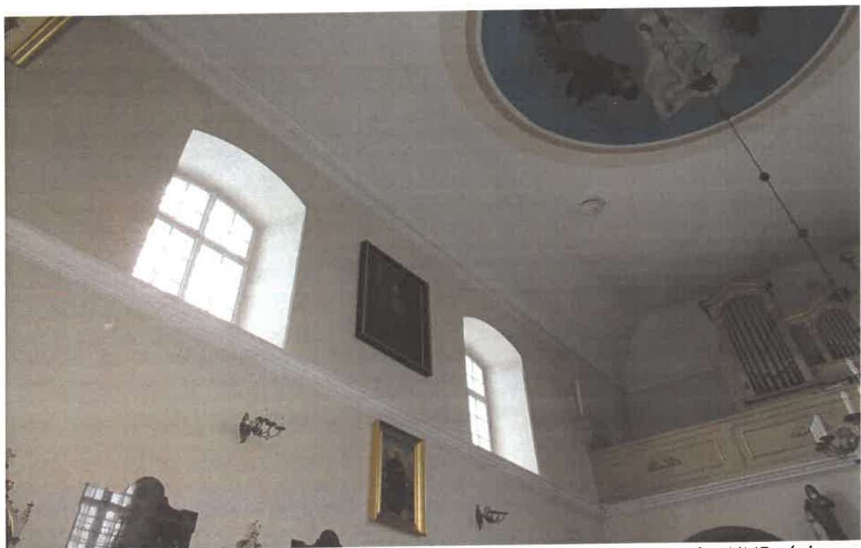
Fot. Nr 3 – Milanów, Kościół pod wezwaniem Niepokalanego Poczęcia NMP, ściana południowa. Fot. Tomasz Iwanicki, Luty 2023.