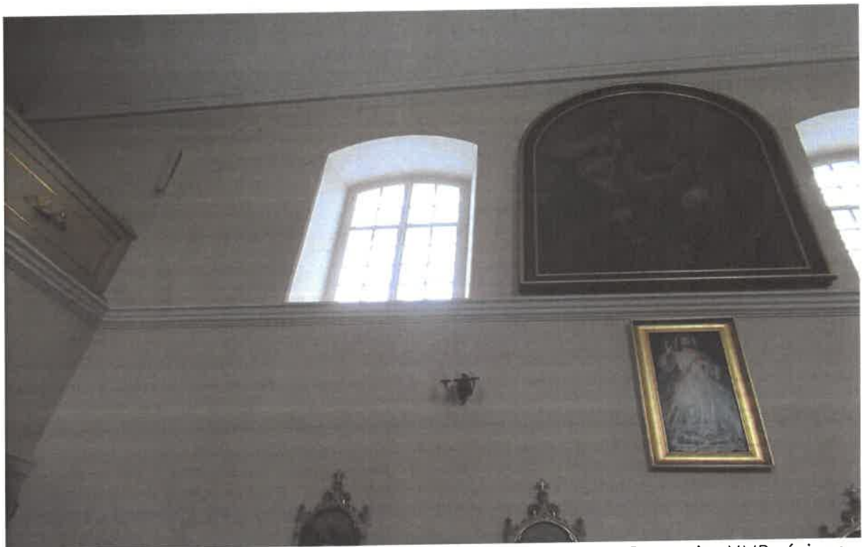
Fot. nr 9 – Milanów, Kościół pod wezwaniem Niepokalanego Poczęcia NMP, ściana północna. Fot. Tomasz Iwanicki, Luty 2023.