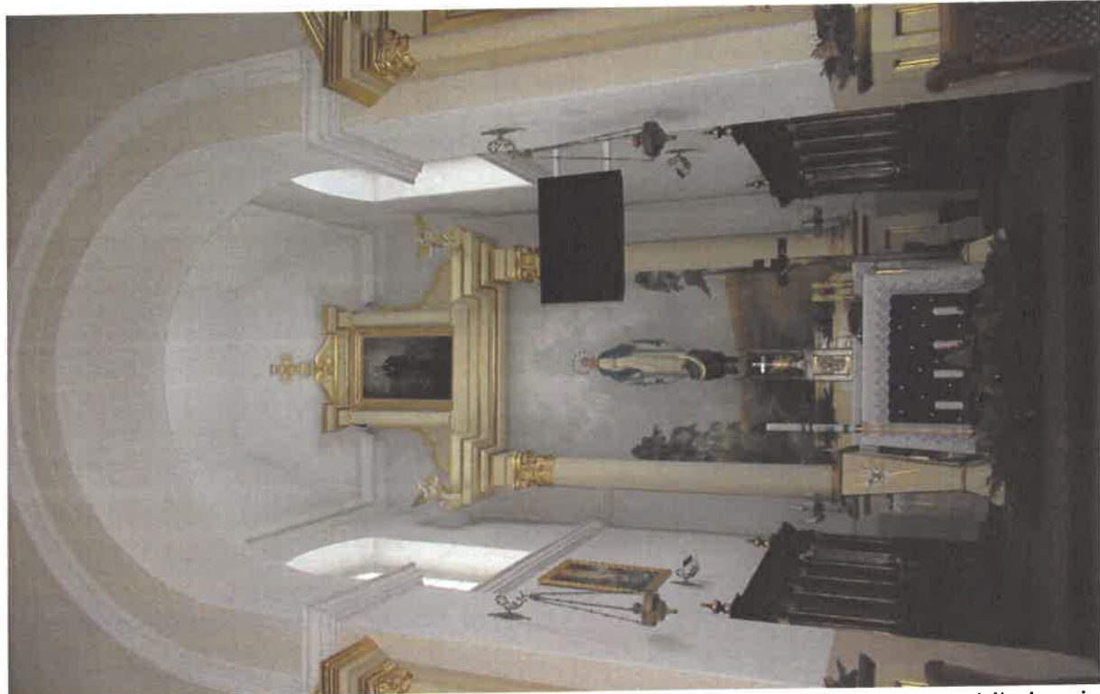
Fot. nr 7 – Milanów, Kościół pod wezwaniem Niepokalanego Poczęcia NMP, prezbiterium i ołtarz główny. Fot. Tomasz Iwanicki, Luty 2023.