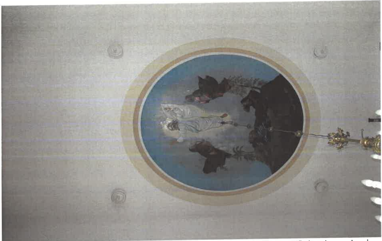
Fot. nr 4 – Milanów, Kościół pod wezwaniem Niepokalanego Poczęcia NMP, tondo na stropie.