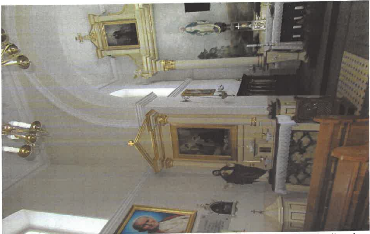
Fot. nr 6 – Milanów, Kościół pod wezwaniem Niepokalanego Poczęcia NMP, ołtarz św. Stanisława Kolbe. Fot. Tomasz Iwanicki, Luty 2023.