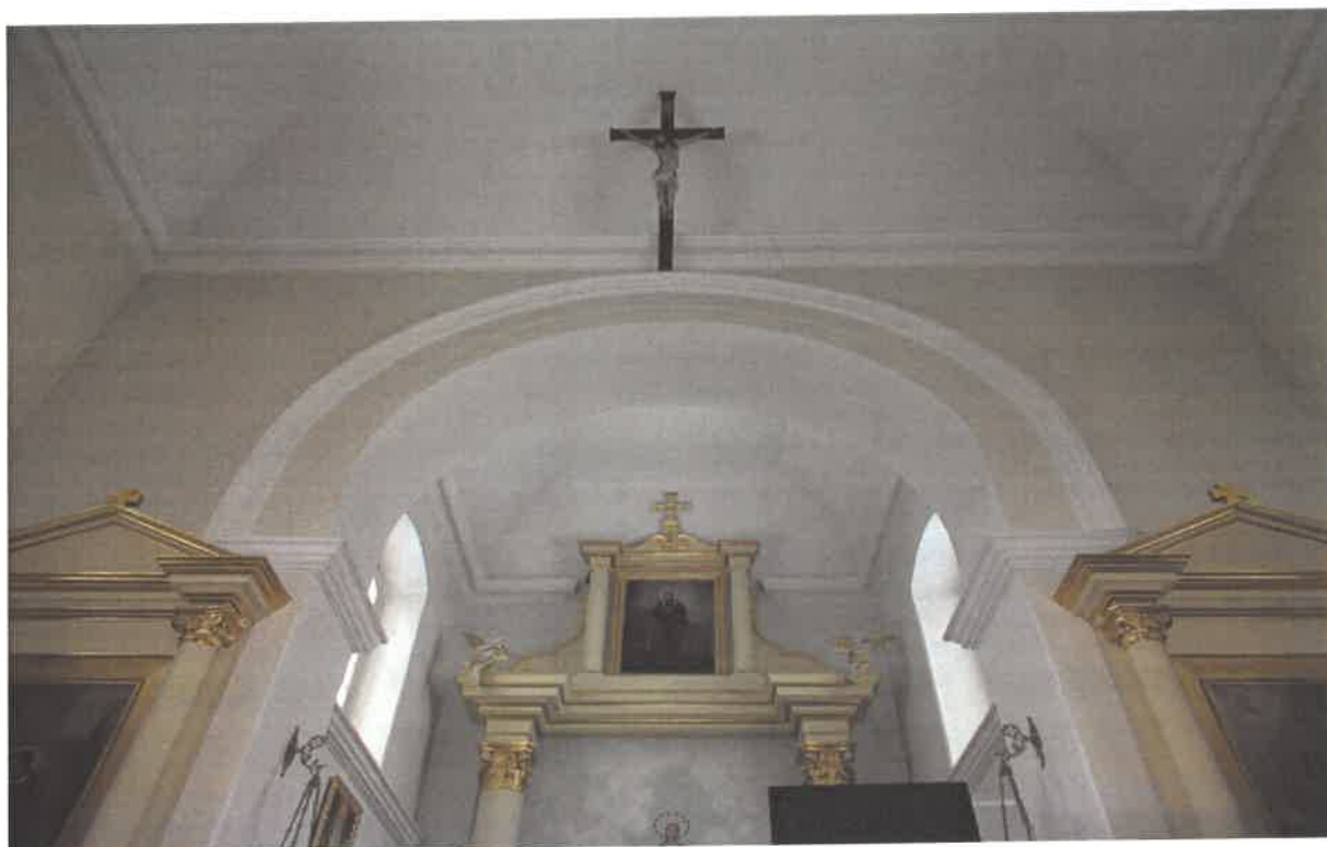
Fot. nr 1 – Milanów, Kościół pod wezwaniem Niepokalanego Poczęcia NMP, łuk tęczowy.