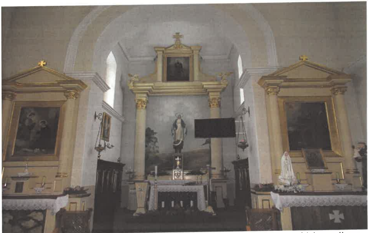
Fot. 5 – Milanów, Kościół pod wezwaniem Niepokalanego Poczęcia NMP, widok na ołtarze.